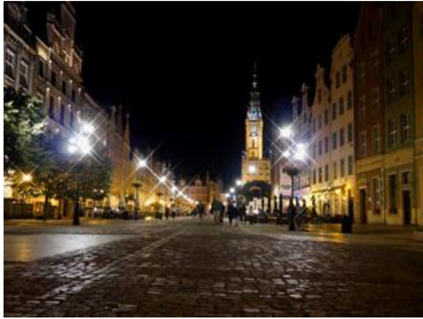
La Rue Longue de la vieille ville de Gdansk

Westerplatte (commencement de la deuxième Guerre Mondiale). Monument et musée de Solidarnosc. Temps libre à Gdansk.