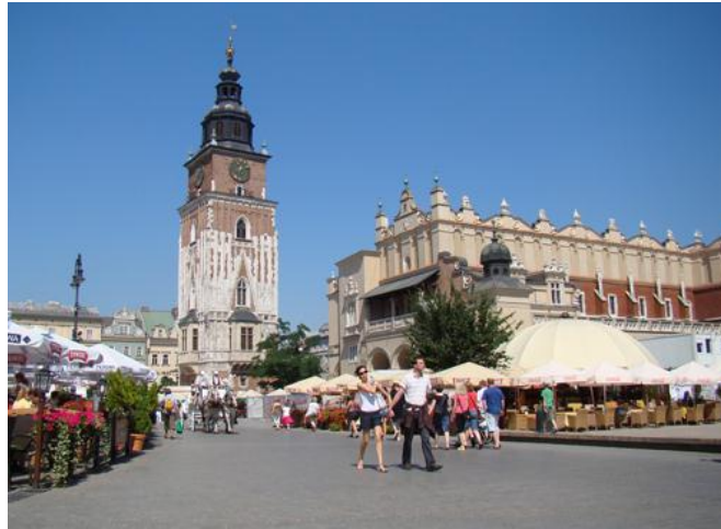
« Rynek », la place du marché à Cracovie

Visite de la vieille ville : église St Anne, Kolegium Maius, église st François...Visite du château royal de Wawel et de la cathédrale. Temps libre. Soir, Cracovie « by night » Retour et nuit à Bydgoski.