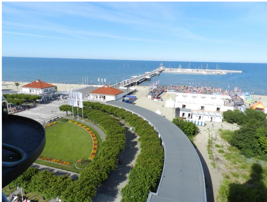
Vue sur la Baltique à Sopot

En Train électrique pour la station balnéaire de Sopot. Le Molo, le plage... Repas du midi « Tawerna Rybaki » au bord de la plage. Temps libre. Hypermarché pour les derniers achats. Repas « d'au revoir » au « Salonik Oliwski ». Nuit à l'hôtel universitaire de Gdansk.