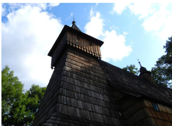
Église en bois de Debno

Départ pour les Carpates. Église en bois de Debno. Poronin.