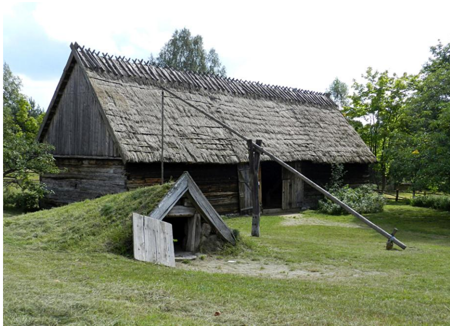
Skansen de Wdzydze Kiszewskie

Visite du Skansen de Wdzydze Kiszewskie. Retour à Debrzyno. Temps libre dans la forêt et au bord du lac. Collation au feu de bois avec la musique cachoube. Nuit à Debrzyno.