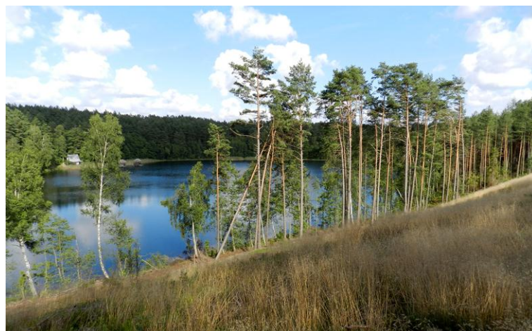
région lacustre de Kaszuby

En route pour la région lacustre de Kaszuby (en Poméranie). Arrêt à Chelmno « Carcassonne polonais ». Installation à Debrzyno, dans la forêt, au bord d'un lac.