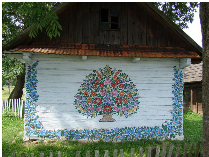
village peint de Zalipie

Route pour Varsovie. Visite du village peint de Zalipie. Dans le car, projection d'un film historique sur Varsovie. Soir : collation et installation à l'hôtel « Aramis » de Varsovie.