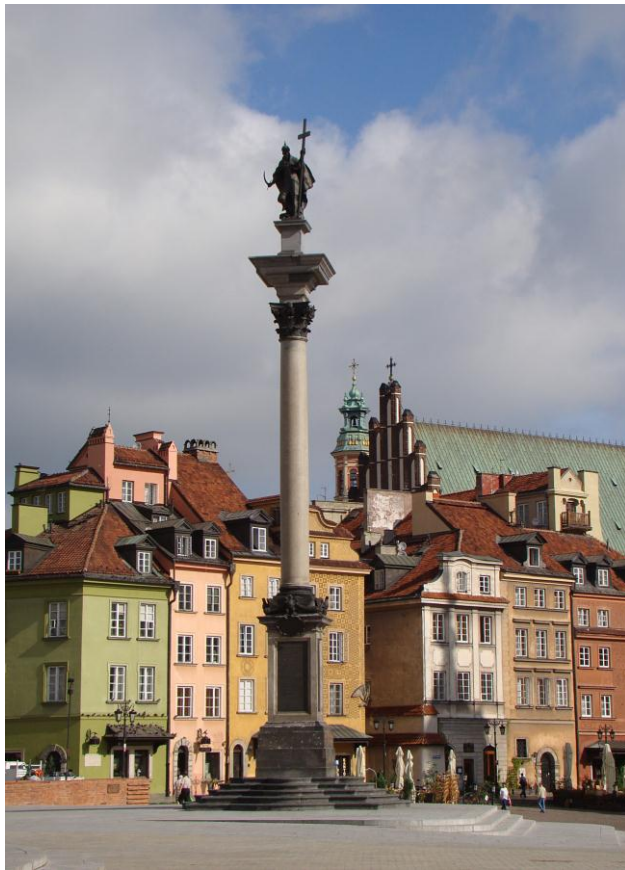
La vieille ville de Varsovie