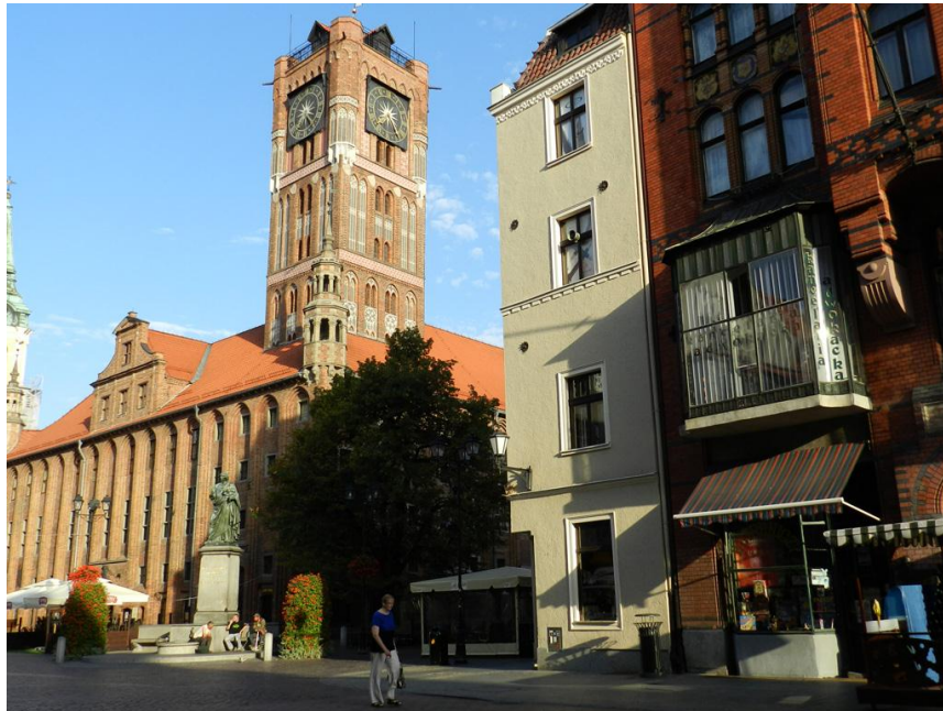
L'hôtel de ville de Torun

Départ de Varsovie. Route pour Torun (ville en cours de jumelage avec Angers), ville natale de Nicolas Copernic, fondée par les chevaliers teutoniques. C'est un ancien port fluvial de la Hanse. La vieille ville est classée sur la liste du Patrimoine Mondial de l'UNESCO. Promenade dans la vieille ville et visite du planétarium... Nuit à l'hôtel « Copernic » à Torun.