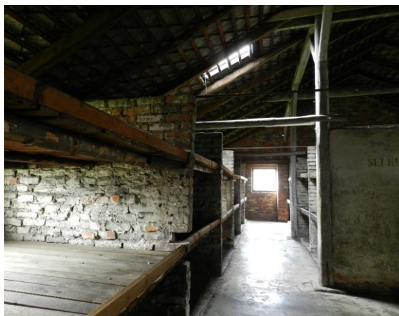
Camp de Birkenau

Visite du Camp d'Oswiecim - Auschwitz, le plus grand camp d'extermination Nazi. Lieu de souvenir, classé sur la liste du Patrimoine Mondial de l'UNESCO. Retour à Cracovie en passant par Wadowice, la ville natale de Jean-Paul II. Arrêt à Lanckorona - un village d'un autre temps. Nuit à Cracovie, à l'hôtel « Bydgoski ».