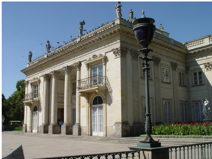
Palais de Lazienki

Visite du musée de l'Insurrection de Varsovie. Repas de midi au restaurant de la Polytechnique de Varsovie. Promenade dans le parc du palais de Lazienki, monument Chopin. Soir, la Conférence sur Chopin à l'Académie des Sciences. Collation et nuit à l'hôtel « Aramis » de Varsovie.