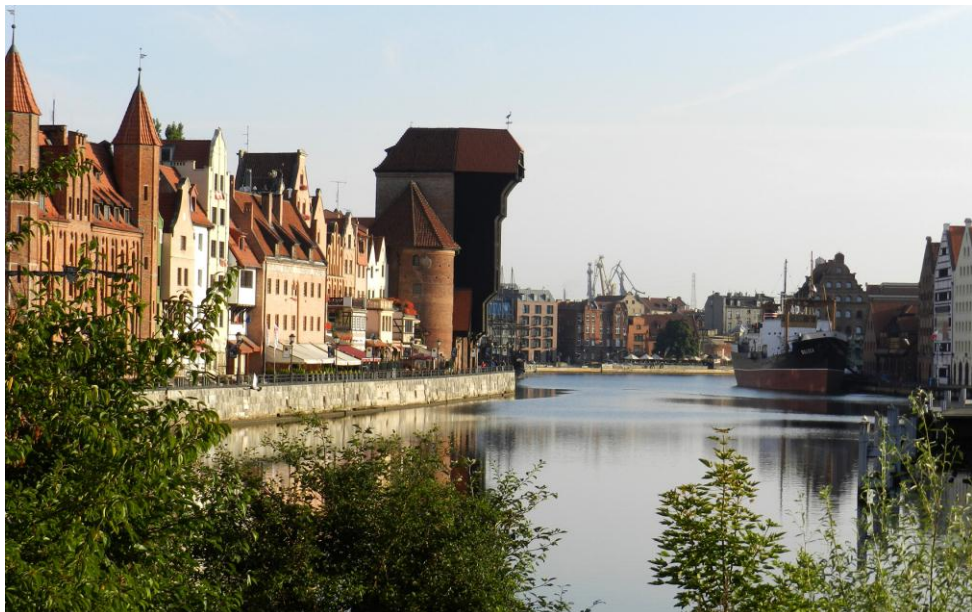
Vieux port de Gdansk

Départ pour Gdansk par Malbork. Visite du château des chevaliers teutoniques de Malbork classée sur la liste du Patrimoine Mondial de l'UNESCO. L'imposant château construit au XIIIe/XIVe siècle, fut siège du Grand Maître de l'Ordre des Chevaliers Teutoniques. Ce château gothique est la plus vaste forteresse médiévale d'Europe. Repas au restaurant du château. Route pour Gdansk, l'une des plus belles villes du Nord de l'Europe. Nuit à l'hôtel universitaire « Hilton ».