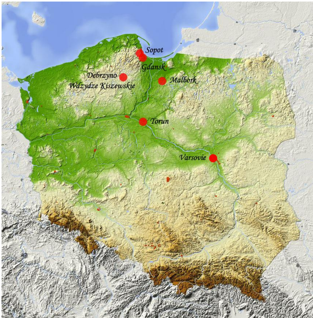
Circuit dans le nord de la Pologne